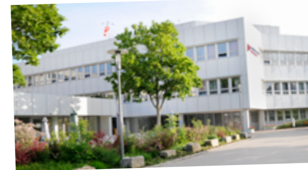
medius KLINIK KIRCHHEIM

Damit das so bleibt und sogar noch besser wird, braucht es hervorragende Bildungsangebote. Deshalb betreiben wir die Berufsfachschulen für Pflege in Nürtingen und Ostfildern-Ruit sowie die Akademie in Kirchheim unter Teck. Darüber hinaus kooperieren wir mit verschiedenen Berufsfach- und Hochschulen und sind akademisches Lehrkrankenhaus der Universität Tübingen.