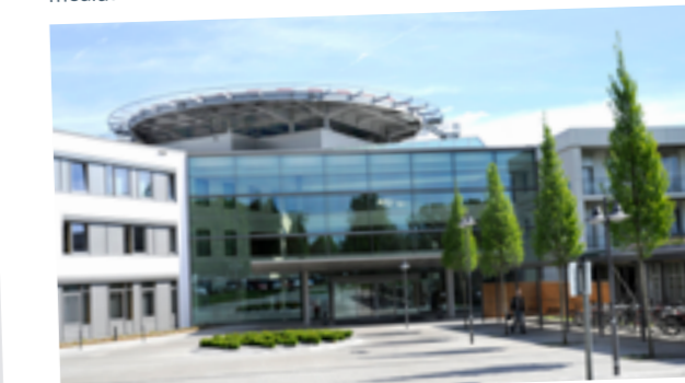
medius KLINIK OSTFILDERN-RUIT