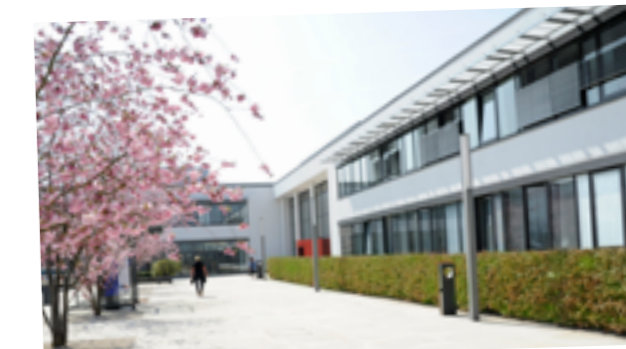
medius KLINIK NÜRTINGEN